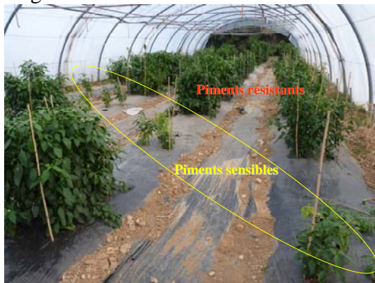
Expérimentation de piments résistants sur parcelle très infestée

Des expériences en conditions contrôlées (pièces climatisées et serres) et en conditions agronomiques (parcelles expérimentales sous abri froid) sont en cours pour 3 ans afin d'étudier le mode d'action de ces gènes pour choisir les plus intéressants à combiner (« pyramider ») dans différents fonds génétiques sensibles, le contournement possible de ces gènes et dans quelles conditions, tester l'influence de leur déploiement spatio-temporel (successions ou mélanges) sur l'apparition de souches virulentes de nématodes, ainsi que l'impact des variétés résistantes sur la structure des populations de nématodes phytoparasites en général.