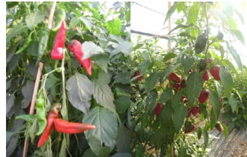
Piments sensibles et piments résistants aux nématodes à galles

Chez le piment Capsicum annuum , plusieurs gènes de résistance aux nématodes à galles, gènes Me , ont été identifiés et caractérisés (Djian-Caporalino et al. , 1999, 2007). Trois d'entre eux sont efficaces contre un large éventail d'espèces, y compris les espèces les plus communes dans les régions tropicales ou méditerranéennes. En outre, ces gènes de résistance présentent une stabilité fonctionnelle à haute température, intéressante sous climat chaud. Nous avons déjà montré des différences importantes dans les mécanismes d'action mis en jeu (Pegard et al. , 2005) et démontré que certains de ces gènes étaient contournables en conditions artificielles (Castagnone-Sereno et al. , 2001); pour d'autres, le contournement s'est avéré impossible dans un contexte génétique bien défini malgré de très fortes infestations de Meloidogyne .