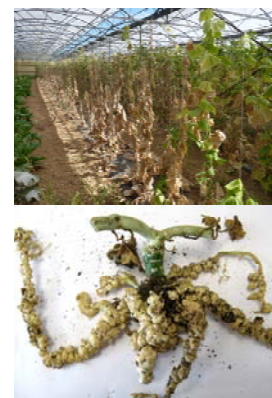
Dégâts de nématodes à galle sur racine de melon greffé et sur culture de concombre

Les systèmes maraîchers sous abri en France s'appuient principalement sur des rotations de cultures de laitue en période hivernale et cultures de solanacées (tomate, poivron, aubergine) ou de cucurbitacées (melons, concombres, courgettes) en été. Cette spécialisation, encouragée par l'environnement économique, et l'interdiction progressive de la plupart des matières actives chimiques (Plan Ecophyto 2018, publié en 2009, & Loi "Grenelle 2" du 12/07/2010), rendent ces systèmes fragiles vis-à-vis des parasites telluriques. Une enquête récente (2007-2010), conduite par l'INRA dans la région Provence-Alpes-Côte d'Azur (Djian-Caporalino, Phytoma 2010), souligne l'importance particulière des nématodes à galles dans plus de 40% des exploitations conventionnelles et en agriculture biologique.