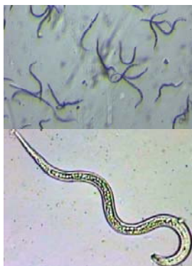
Larves de nématodes (Anguillule) des racines vues à la loupe binoculaire